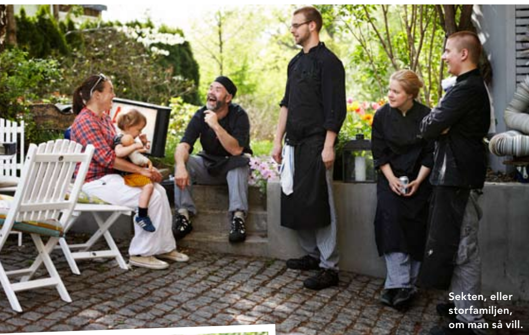
Sekten, eller storfamiljen, om man så vill.