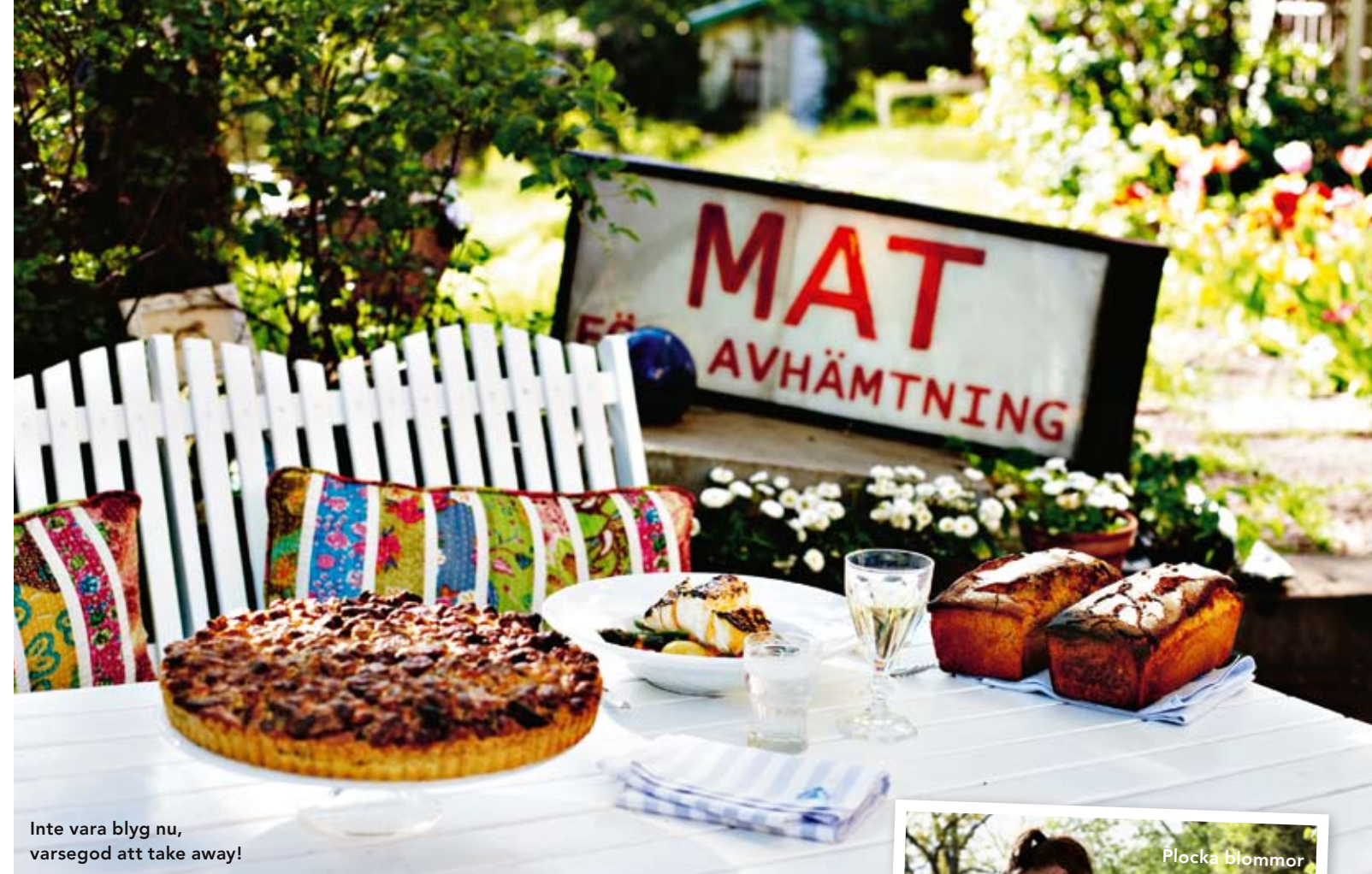
Inte vara blyg nu, varsegod att take away!