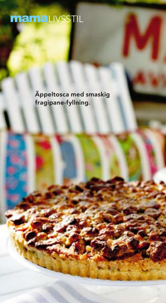
Äppeltosca med smaskig fragipane-fyllning.