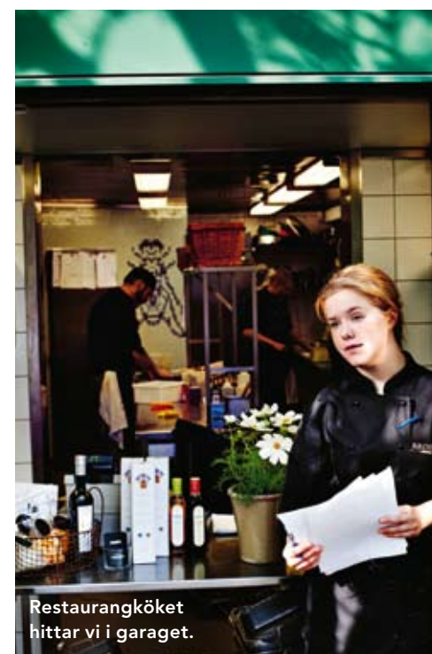
Restaurangköket hittar vi i garaget.

– Jag är så nöjd! Det här är mitt ideal, det är så jag är uppvuxen. Mamma var sömmerska med ateljé hemma och i vårt hem var det alltid fullt med folk, alla var välkomna. Mamma