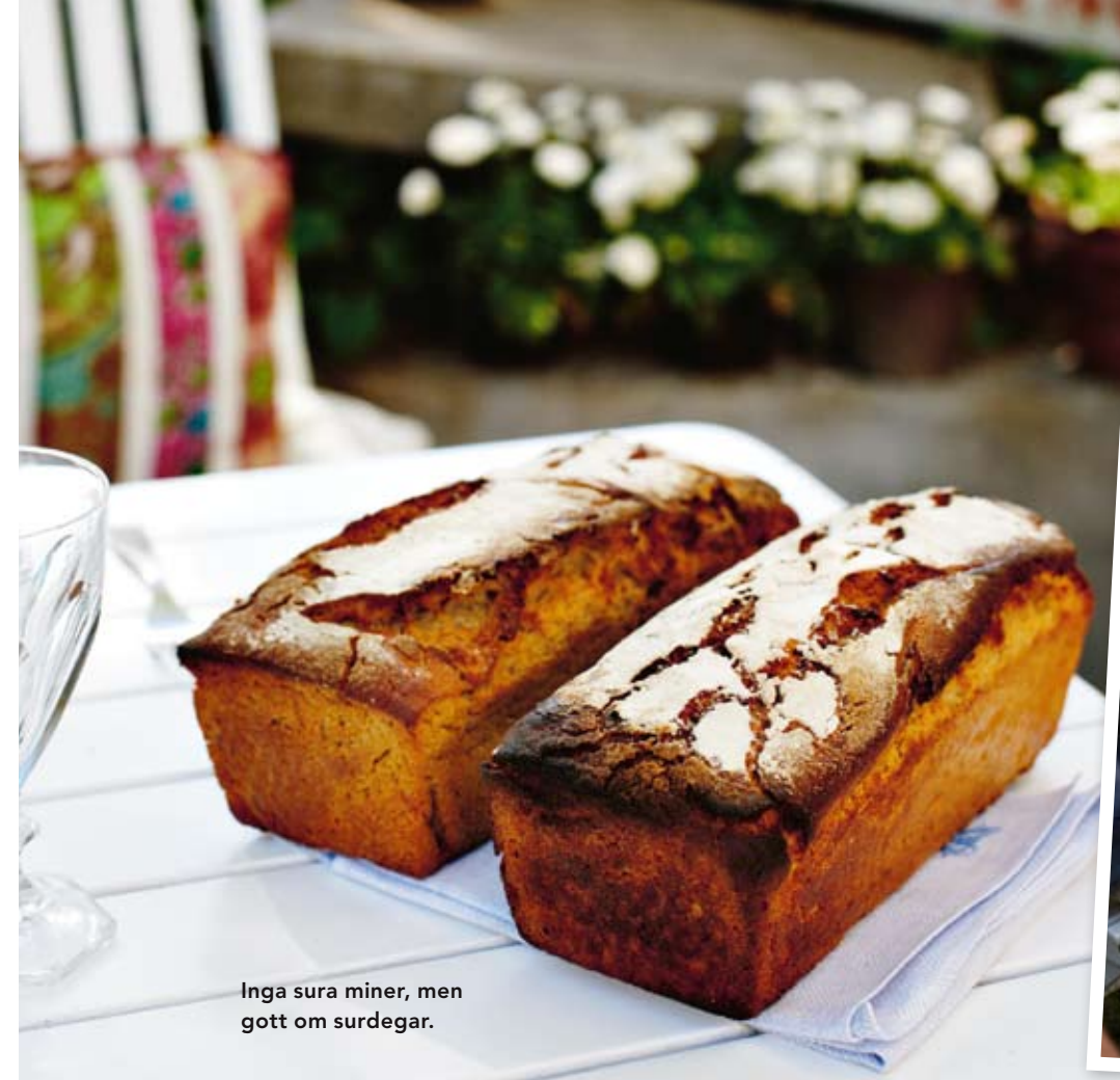
Inga sura miner, men gott om surdegar.