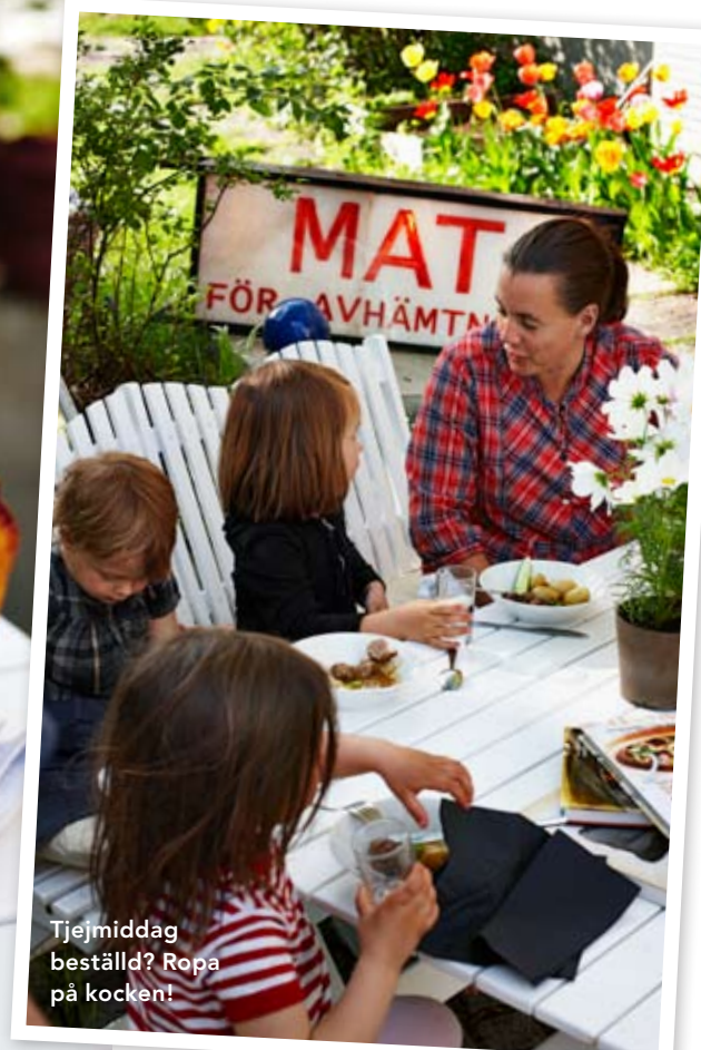
Tjejmiddag beställd? Ropa på kocken!

TIGERNS LÖSNING: PERFEKT KLIMATKONTROLL VID HÖGA TEMPERATURER