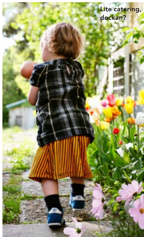
Lite catering, dockan?