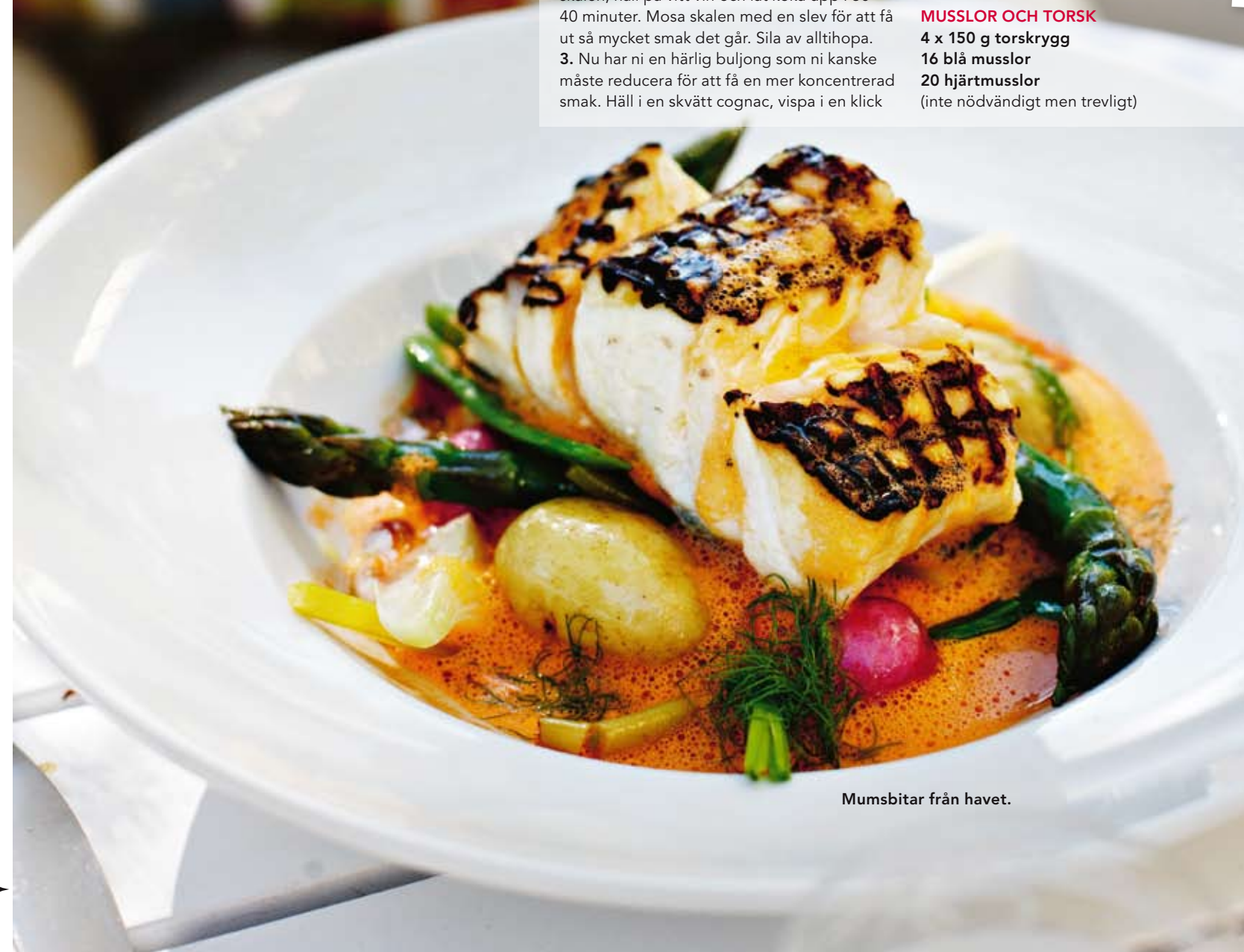
Mumsbitar från havet.